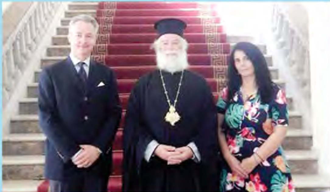
Ελληνισμού και της Ορθοδοξίας, Αλεξανδρινού Προκαθημένου ιεραποστολικό έργο που αλλά και προς το πρόσωπο του για το σπουδαίο επιτελεί στην Αφρική.

Από την πλευρά του ο κ. Γενικός ευχαρίστησε τον Πατριάρχη για τη θερμή υποδοχή, εξέφρασε την βαθειά εκτίμηση και την αγάπη που έχει προς το παλαιό Πατριαρχείο Αλεξανδρείας και πάσης Αφρικής, ως κιβωτό των αξιών και των ιδανικών του