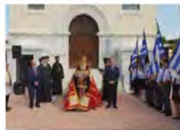
Patriarch Theodore II of Alexandria inaugurated the St. Mary's Assumption Church in a Greek community cemetery in Alexandria on the National Greek Day, Spokesman for