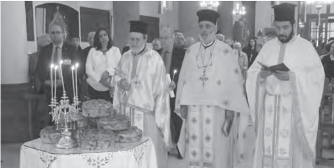
Αποψη από το μνημόσυνο - αρτοκλασία.

Στις 14 Μαΐου 2017, τελέστηκε στην Ιερά Μητρόπολη Βρυξελλών, Μνη-