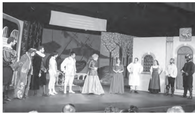
Στιγμιότυπο από την παράσταση

Η σκηνοθεσία και η μετάφραση του έργου που αναφέρεται στην εποχή γύρω από το 1500 μ.Χ., έγι-