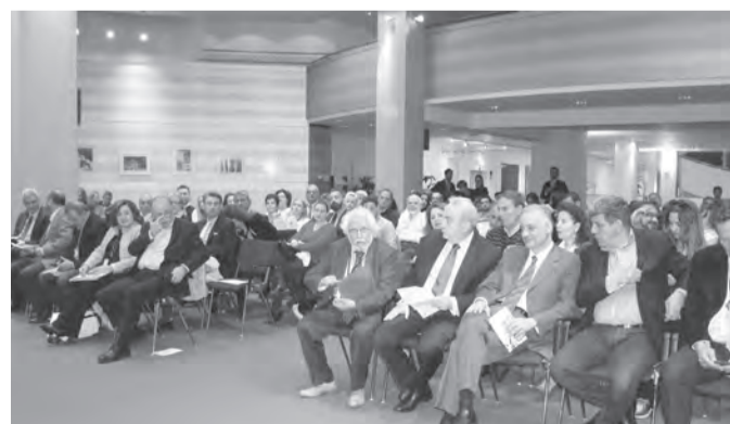
Αποψη της αίθουσας «Γεχουντί Μενουχίν», του ΕΚ.

Την ομιλία ακολούθησαν παρεμβάσεις και ερωτήσεις προς τον ομιλητή από Έλληνες και ξένους ευρωβουλευτές, από στελέχη του Κοινοβουλίου και της Επιτροπής, αλλά και από νέους ακροατές που είχαν πλημμυρίσει την αίθουσα. Με αφορμή την Τριλογία Ελληνικού Πολιτισμού, ο κ. Γραμματικάκης