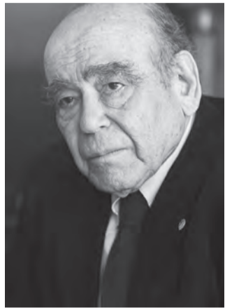
Ο Θανάσης Βαλτινός

Το συγγραφέα και ακαδημαϊκό κ. Θανάση Βαλτινό, προσκεκλημένο από το Ελληνικό τμήμα του Ευρωπαϊκού σχολείου, είχαν την ευχαρίστηση να συναντήσουν, αρκετοί από τους ακροατές της δι-άλεξης για την μετανάστευση του καθηγητή κ. Κουλουμπαρίση, που έγινε στο Ελεύθερο Πανεπιστήμιο των Βρυξελλών στις 16 Μαΐου στα πλαίσια των εκδηλώσεων της Ελληνικής Κοινότητας Βρυξελλών για τα 60 χρόνια του ελληνισμού στο Βέλγιο.