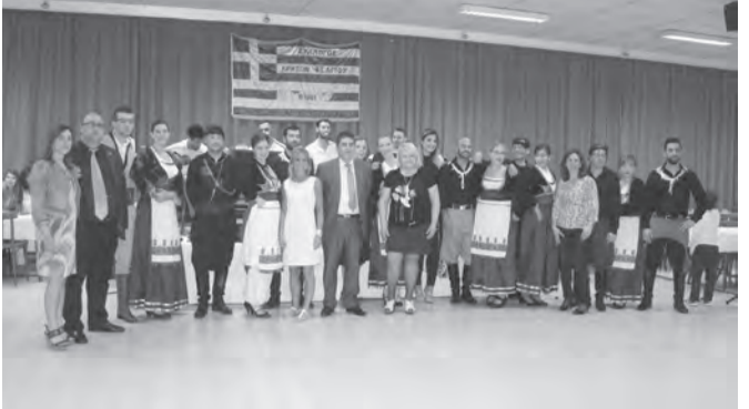
Στιγμιότυπο με το χορευτικό και μέλη του Δ.Σ. του Συλλόγου Κρητών

Στο τέλος, αφού ευχαρίστησε όλους όσους συνέβαλαν στην επιτυχία της εκδήλωσης, το λόγο έλαβε το χορευτικό του Συλλόγου το οποίο