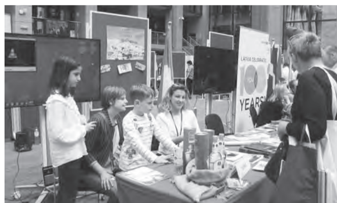
Αποψη από το Ελληνικό Περίπτερο της ΜΕΑ

Το ελληνικό περίπτερο, ανάμεσα στα 28 των κρατών-μελών της Ευ-