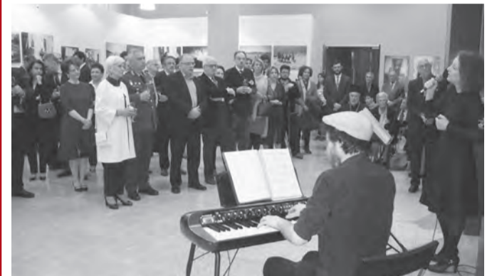
Αποψη από την έκθεση φωτογραφίας του Robert McCabe, που πλαισιώθηκε από συναυλία μουσικής

Τα εγκαίνια της έκθεσης πλαισιώθηκαν μουσικά από συναυλία