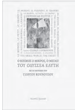
Η εικόνα του εξώφυλλου