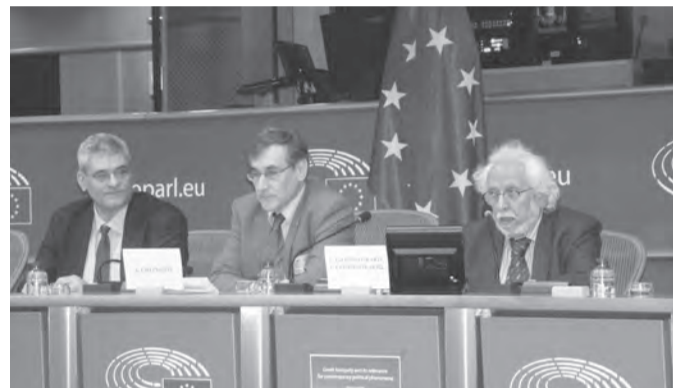
Αποψη από την ομιλία του Αγγελου Χανιώτη. Στα αριστερά του ο Ευρ. Γιώργος Γραμματικάκης και δεξιά του ο Ευρ. Μίλτος Κύρκος

Σε μια σύντομη ομιλία του πριν από την παράσταση, ο κ. Γραμματικάκης αναφέρθηκε στο σπουδαίο έργο της Λυρικής Σκηνής τα