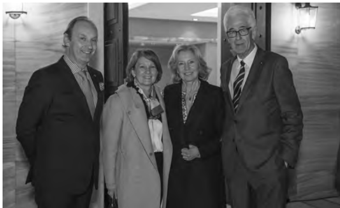
Από αριστερά ο Πρέσβης του Βελγίου σε Ελλάδα και Κύπρο, κ. Luc Liebaut και η σύζυγός του, δίπλα τους η σύζυγός και ο καθηγητής κ. Robert Laffineur.

Η τελευταία «Συνάντηση», που ήταν και η δέκατη έκτη, πραγμα-