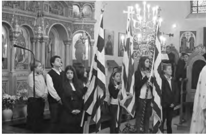
Αποψη από τη δοξολογία με τους σηματοφόρους των ελληνικών σχολείων

Ο Μητροπολίτης Βελγίου προεξήρχε της Θείας Λειτουργίας στο Μητροπολιτικό Ναό των Βρυξελλών, όπου παρέστη και ο Μητροπολίτης Αχαΐας κ. Αθανάσιος, Διευθυντής του γραφείου παρά τη Ε.Ε. της Εκκλησίας της Ελλάδος.