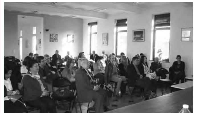
Αποψη από την ομιλία στο Ελληνικό και Διαπολιτιστικό Κέντρο Βρυξελλών

Ακολούθησαν ερωτήσεις και συζήτηση με το κοινό, πολλές και πολύ ενδιαφέρουσες ερωτήσεις αφορούσαν: Τις συνθήκες εργασίας των ανθρακωρύχων, την κοινω-