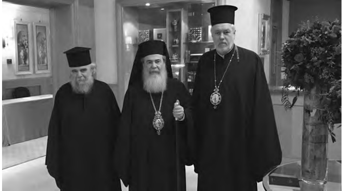
Από δεξιά, ο Μητροπολίτης Βελγίου, ο Πατριάρχης Ιεροσολύμων και ο Αρχιεπίσκοπος και Αρχηγραμματέας Ιεροσολύμων κ. Αρίσταρχος.

Κατά την άφιξη του στο Διεθνή αερολιμένα των Βρυξελλών, τον Μακαριότατο υποδέχθηκε ο επίσκοπος Μητροπολίτης Βελγίου και Έξαρχος Κάτω Χωρών και Λουξεμβούργου κ. Αθηναγόρας, συνοδεία κληρικών της Μητροπόλεως.