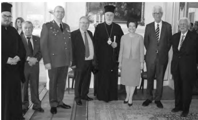
Η Πρέσβης κα Γαλαθιανή πλαισιωμένη από καλεσμένους της, μεταξύ των οποίων ο Μητροπολίτης μας κ. Αθηναγόρας, ο Αντιστράτηγος κ. Νικόλαος Ζαχαριάδης, ο Επίτιμος Πρόξενος της Ελλάδας στη Λιέγη κ. Robert Laffineur, κα.

Στον κήπο εξάλλου και η οικοδέσποινα, σε σύντομη ομιλία της,