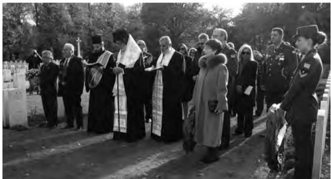
Στιγμιότυπο από την επιμνημόσυνη δέηση προεξέχοντος του Μητροπολίτη μας κ. Αθηνάγορα

Κατάθεσαν στεφάνι, ο Πρέσβης της Κύπρου κ. Γρίβας, η πρέσβης της Ελλάδας κα Γαλαθιανάκη, ο Αντι-