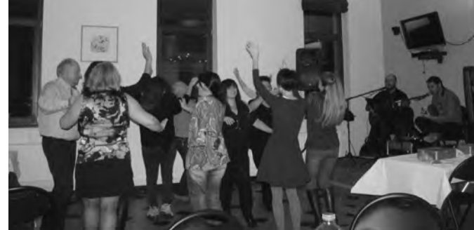
Στιγμιότυπο από τη ρεμπέτικη βραδιά στο Ελληνικό Κέντρο

Η μουσική βραδιά εντάχθηκε και φέτος στα πλαίσια των εκδηλώσεων του Parcours de Diversité του Δήμου Saint Gilles. Είναι μια πρωτοβουλία της Mission Locale, που διοργανώνεται με την υποστήριξη του Δήμου του Saint-Gilles (Echevins de la Cohésion Sociale, Jeunesse de la commune de Saint-Gilles, Service Culture de la commune de Saint-Gilles), της Γαλλόφωνης Κοινότητας Βελγίου (CoCoF), του ομοσπονδι-