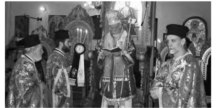
Στιγμιότυπο από τη Θεία Λειτουργία προεξάρχοντος του Μητροπολίτη Γερμανίας κ. Αυγουστίνου

Στο τέλος της Θείας Λειτουργίας ο Σεβασμιότατος Μητροπολίτης Βελγίου κ. Αθηνάγορας ευχαρίστησε,