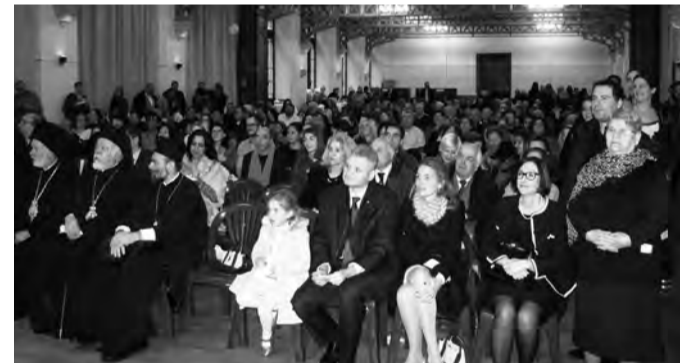
Αποψη από τη δεξίωση της Μητρόπολης

Στην αντιφώνησή του ο Σεβασμιότατος Μητροπολίτης Γερμανίας κ. Αυγουστίνος, αφού ευχαρίστησε τον Μητροπολίτη Βελγίου κ. Αθηνάγορα, αναφερόμενος με τα καλύτερα λόγια στο έργο που επιτελεί, χαιρέτησε τον Απόδημο Ελληνισμό