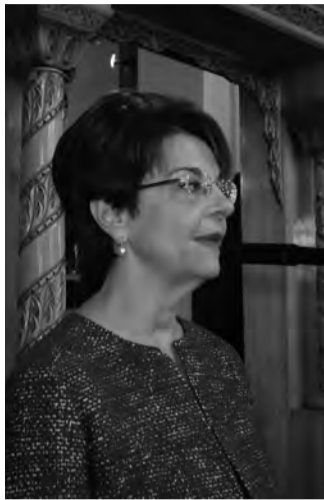
Η Πρέσβης κα Γαλαθιανάκη

Με επισημότητα τελέσθηκε την Κυριακή 30 Οκτωβρίου 2016 η Δοξολογία για την Εθνική Επέτειο της 28ης Οκτωβρίου στον Ιερό Μητροπολιτικό Ναό των Παμμεγίστων Ταξιαρχών Βρυξελλών.