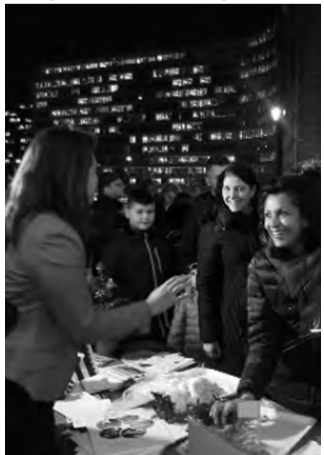
Το περίπτερο του ΕΟΤ στην πλατεία Σούμαν

Ο Ελληνικός Εθνικός Οργανισμός Τουρισμού, γραφείο ΕΟΤ Κάτω Χωρών σε συνεργασία με τον μη κυβερνητικό οργανισμό "A Discovering Network", συμμετείχαν με επιτυχία, στις 7 Δεκεμβρίου, στο κέντρο της Ευρώπης και των Ευρωπαϊκών Οργάνων, στην Πλατεία Σούμαν των Βρυξελλών, όπου κέρασαν Χριστουγεννιάτικα γλυκά, κουραμπιέδες και μελομακάρονα καθώς και συνταγές στους παρευρισκόμενους.