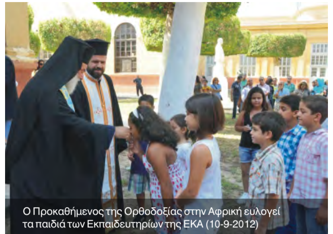
Ο Προκαθήμενος της Ορθοδοξίας στην Αφρική ευλογεί τα παιδιά των Εκπαιδευτηρίων της ΕΚΑ (10-9-2012)

Αυτό είναι το μήνυμα που σας στέλνω από την Αφρική, τη γη όπου ο Θεός μας μιλά μέσω των άλλων για να μας διδάξει και να μας μεταμορφώσει τη γη όπου ο Θεός χρησιμοποιεί εμάς για να μεταμορφώσει τους άλλους.