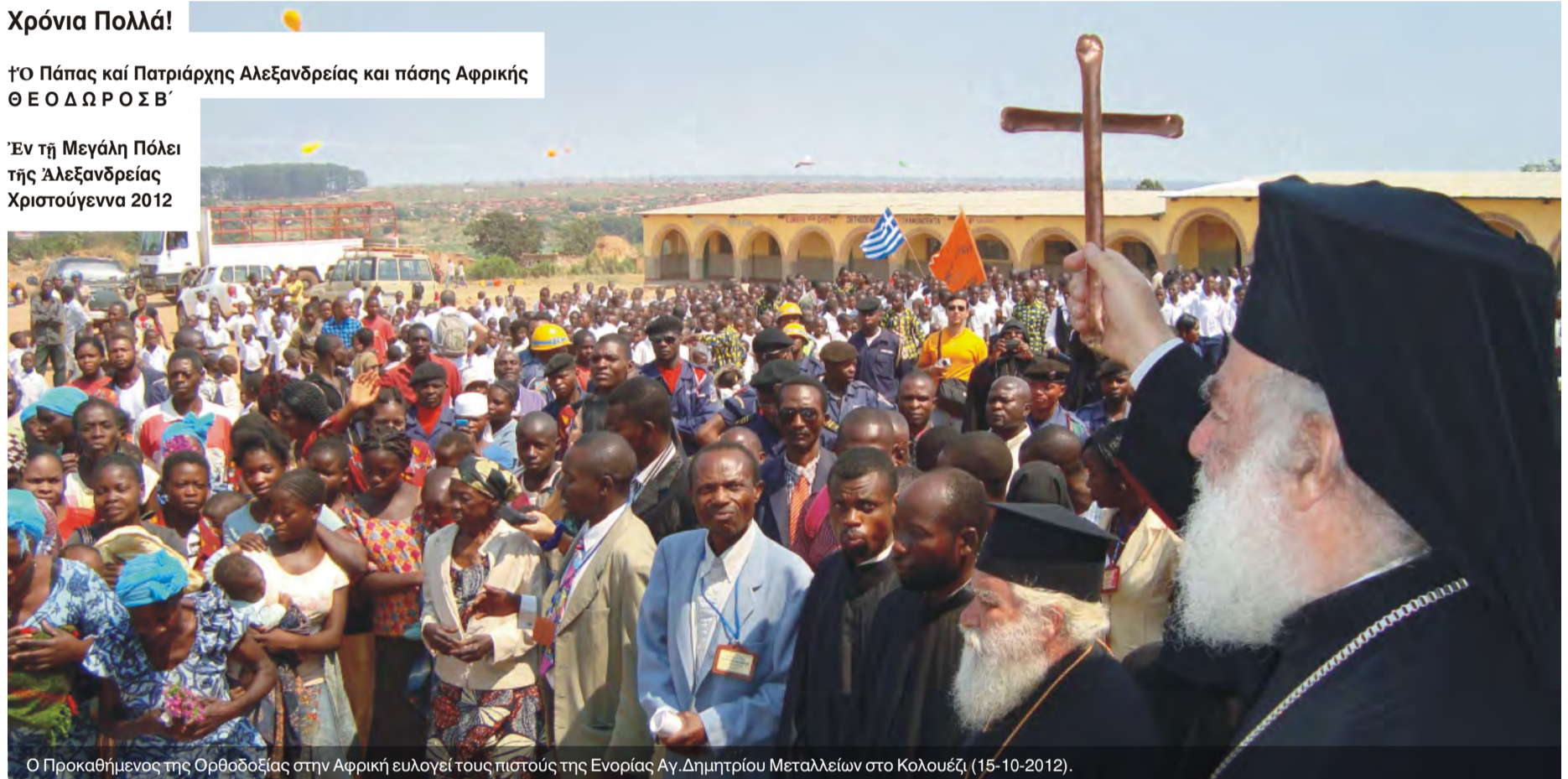
Ο Προκαθήμενος της Ορθοδοξίας στην Αφρική ευλογεί τους πιστούς της Ενορίας Αγ. Δημητρίου Μεταλλείων στο Κολουέζι (15-10-2012).

Έν τη Μεγάλη Πόλει της Αλεξανδρείας Χριστούγεννα 2012