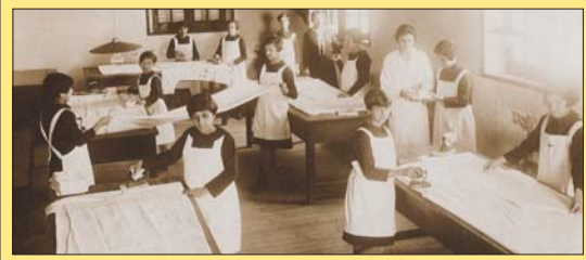
ΤΑ ΚΟΡΙΤΣΙΑ ΤΟΥ ΜΠΕΝΑΚΕΙΟΥ ΟΡΦΑΝΟΤΡΟΦΕΙΟΥ ΣΕ ΜΙΑ ΑΠΟ ΤΙΣ ΚΑΘΗΜΕΡΙΝΕΣ ΔΡΑΣΤΗΡΙΟΤΗΤΕΣ ΤΟΥ

Το Μπενάκειο Ορφανοτροφείο ιδρύθηκε το 1909 με δωρεά της οικογένειας Μπενάκη και συγκεκριμένα των Εμμανουήλ και Βιργινίας Μπενάκη. Το Μπενάκειο έκανε δεκτά κορίτσια τα οποία ήταν ορφανά από δύο γονείς, ή είχαν μόνο έναν γονέα ο οποίος αδυνατούσε να καλύψει τις ανάγκες του παιδιού. Το ίδρυμα παρείχε τη στοιχειώδη εκπαίδευση (δημοτικό) στις τροφίμους κοπέλες που φυσικά έμεναν εσώκλειστες και δεν δικαιούνταν να αποχωρήσουν από το ίδρυμα πριν ολοκληρώσουν τη βασική τους μόρφωση. Όσες το επιθυμούσαν στέλνονταν στα δευτεροβάθμια σχολεία της Ε.Κ.Α. (Σαλβάγειο, Αβερωφείο, Αγγλικές Σχολές κ.ά.), ενώ οι υπόλοιπες μπορούσαν να παρακολουθήσουν το τμήμα Οικοκυρικής που λειτουργούσε στο Ορφανοτροφείο. Η προσφορά του ιδρύματος ήταν μεγάλη. Μέσα σε αυτό οι εσώκλειστες κοπέλες μάθαιναν κοπτική και ραπτική, καθώς και κάποιες άλλες εργασίες τεχνικής φύσης. Το ίδρυμα είχε κατά κάποιο τρόπο μια αυτοτέλεια, υπό την εποπτεία της ΕΚΑ φυσικά. Η εποπτεία όμως της καθημερινής δραστηριότητας βρισκόταν κάτω από τη