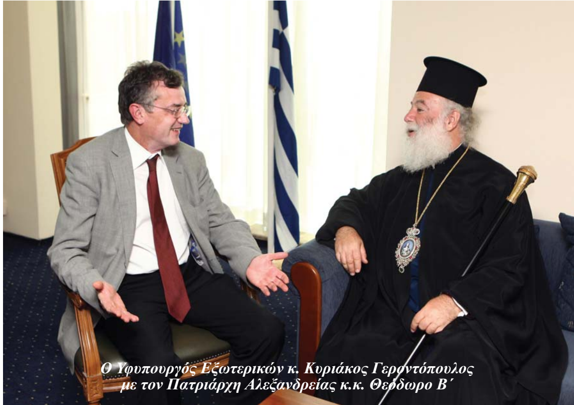
Ο Υπουργός Εξωτερικών κ. Κυριάκος Γεροντόπουλος με τον Πατριάρχη Αλεξάνδρειας κ.κ. Θεόδωρο Β'

Μ ε ιδιαίτερη συγκίνηση απευθύνομαι στον Ελληνισμό της Αλεξάνδρειας με την ευκαιρία της παρουσίας μου στα εγκαίνια του Ελληνορωμαϊκού Πατριαρχικού Μουσείου και νέου Σκενοφυλακίου Πατριαρχικής Βιβλιοθήκης, στην σημαντική αυτή πόλη. Πόλη σημαντική όχι μόνο για τον Ελληνισμό αλλά και για τον οικουμενικό πολιτισμό.