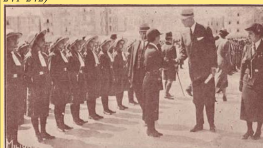
ΟΜΑΔΑ ΟΔΗΓΩΝ ΤΟΥ ΜΠΕΝΑΚΕΙΟΥ "ΕΠΙΘΕΩΡΕΙΤΑΙ" ΑΠΟ ΤΟΝ ΠΡΙΓΚΗΠΑ ΑΝΔΡΕΑ

Το 1970 έπαψε να λειτουργεί το Ορφανοτροφείο που επί τόσες γενιές είχε εκπαιδεύσει και γενικότερα μορφώσει κοπέλες της Ελληνικής παροικίας Αλεξανδρείας. Το κτίριο του Μπενακειού Ορφανοτροφείου παραχωρήθηκε το 1971-1972 στο Ελληνικό Δημόσιο και εκεί στεγάστηκαν οι υπηρεσίες του Γενικού Προξενείου της Ελλάδας στην Αλεξάνδρεια, που λειτουργούν μέχρι και σήμερα. (Πηγή: Σουλογιάννης, Ε. Η Ελληνική Κοινότητα Αλεξανδρείας 1843-1993, Αθήνα: Ε.Λ.Ι.Α, 2005, σσ. 241-242)