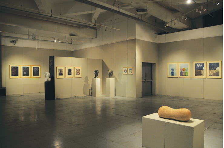
Γενική άποψη του χώρου της έκθεσης.