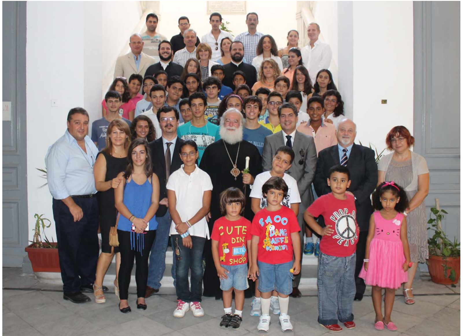
Στιγμιότυπο από την έναρξη της φετινής σχολικής χρονιάς στα Ελληνικά Εκπαιδευτήρια της Αλεξάνδρειας

Μ ε τους καλύτερους οiwονούς ξεκίνησε η φετινή σχολική χρονιά στην ελληνική Αλεξάνδρεια.