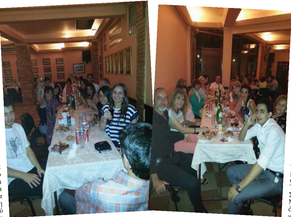
πανεπιστήμιο, αλλά και με τους καθηγητές τους, οι οποίοι ολοκλήρωσαν την απόσπασή

Στις 22 Ιουνίου, και αφού είχαν ολοκληρωθεί με επιτυχία και οι εξετάσεις των μαθητών της Γ' Λυκείου για την εισαγωγή τους στα Αιγυπτιακά πανεπιστήμια, η Ελληνική Κοινότητα Αλεξανδρείας και συγκεκριμένα η Εφορεία Σχολείων διοργάνωσαν ένα αποχαιρετιστήριο "party" για τους καθηγητές και τους μαθητές των Ελληνικών Εκπαιδευτηρίων. Η εκδήλωση έλαβε χώρα στο Εντεκτήριο της Κοινότητας και έδωσε τη δυνατότητα να βρεθούν για μία τελευταία φορά με τη λήξη του Σχολικού έτους, οι μαθητές του γυμνασίου και του λυκείου, με τους πρώην συμμαθητές τους, οι οποίοι από το Σεπτέμβριο θα βρίσκονται στο