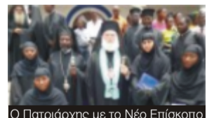
Ο Πατριάρχης με το Νέο Επίσκοπο Ρουάντα-Μπουρούντι και Αφρικανές Μοναχές (24-2-2013)