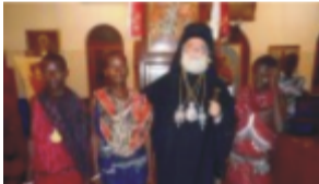
Ο Πατριάρχης εν μέσω αναγνωστών από τη φυλή των Μασάι (17-2-2013)

Μετά το πέρας της Ενθρονίσεως, στον προαύλειο χώρο του Καθεδρικού Ναού, ο Μακ. Πατριάρχης παρακολούθησε υπαίθρια εκδήλωση που διοργάνωσε η τοπική Εκκλησία, με παραδοσιακούς αφρικανικούς χορούς και τραγούδια, ενώ το εσπέρας της ίδιας ημέρας, η Α.Θ.Μ., περατώνασα οσίως την πρώτη της Ποιμαντική επίσκεψη στο Μπουρούντι, ανεχώρησε αεροπορικά για την Κένυα, από όπου επέστρεψε στην Πατριαρχική Καθέδρα στην Αλεξάνδρεια.