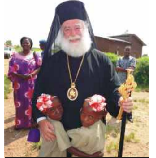
Ο Πατριάρχης περιστοιχισμένος από ορφανά στην Μπουραμάτα (23-2-2013)

Σε μια εποχή καθημερινών μετασηματισμών που επηρεάζουν όλες σχεδόν τις πτυχές της ζωής μας, αμφισβητείται η δύναμη της Εκκλησίας να συμβάλλει στην οικοδόμηση ενός πολιτισμού αλληλοσεβασμού και αλληλεγγύης. Η Στέγη Αγάπης της Μπουραμάτα μαρτυρεί περί του ότι η Εκκλησία στην εγκόσμια μαρτυρία και δράση της προσλαμβάνει, μεταμορφώνει, καινοποιεί τον κόσμο. Διακονεί τον άνθρωπο, αρθρώνει τη δική της πρόταση ζωής, τη δική της ιεράρχηση ζωής, στην κορυφή της οποίας βρίσκεται το παιδί ως ο δυναμικός φορέας της ελπιδοφόρας προοπτικής για ένα κόσμο ἄληθεύοντα ἐν ἀγάπῃ.