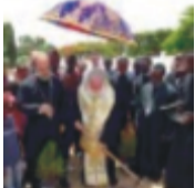
Ο Πατριάρχης θεμελιώνει Παρεκκλήσι στο Νταρ ες Σαλαάμ (17-2-2013)