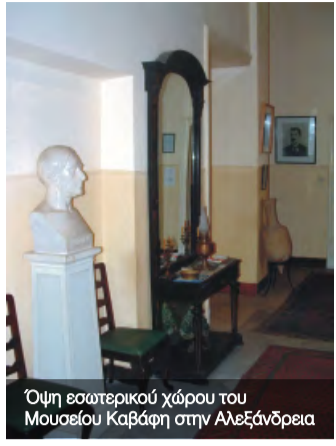
Όψη εσωτερικού χώρου του Μουσείου Καβάφη στην Αλεξάνδρεια

Η μορφή του, αντί να θαμπώνει από τη σκόνη που εναποθέτει το πέρασμα του χρόνου και το κατεχόμενη αντιπονητικό περιβάλλον της εποχής μας, με την οξύτητα του βλέμματός γίνεται ελκυστική και λάμπει, όπως στην πρώτη νεότητά. Ο Καβάφης «στέκει απολύτως ακίνητος σε ελαφρή απόκλιση από το σύμπαν», όπως τον έχει περιγράψει ο Ε. Μ. Φόρστερ. Από το ακίνητο σημείο του τάφου του στο Νεκροταφείο της Ελληνικής Κοινότητας Αλεξανδρείας κοιτάζει με ένα ειρωνικό χαμόγελο που απευθύνεται στους συγκαίριούς του, οι οποίοι δεν μπόρεσαν να αναγνωρίσουν τα ιδιάζοντα γνωρίσματα, την εξέχουσα δραστηριότητα και τις πρωτεϊκές μεταμορφώσεις του ποιητικού έργου του. Κοιτάζει και προς εμάς προειδοποιώντας μας να προσέξουμε να μην ευτελίσουμε την ποιητική δημιουργία του.