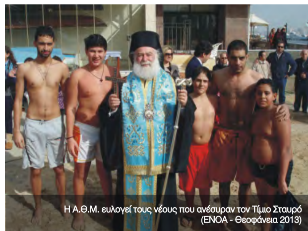
Η Α.Θ.Μ. ευλογεί τους νέους που ανέσπυραν τον Τίμιο Σταυρό (ΕΝΟΑ - Θεοφάνεια 2013)

Επιμέλεια Αρχιμ.Απόστολος Τριφύλλης Δ/ντης Ιδιαίτερου Γραφείου της Α.Θ.Μ.