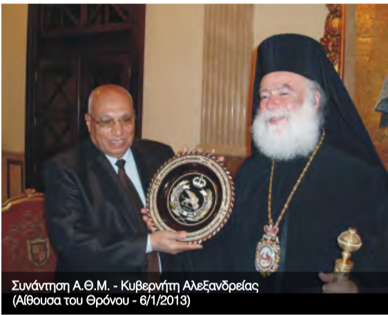
Συνάντηση Α.Θ.Μ. - Κυβερνήτη Αλεξανδρείας (Αίθουσα του Θρόνου - 6/1/2013)

Την ίδια ημέρα η Α.Θ.Μ. δέχτηκε την πρώτη επίσκεψη του νέου Προκαθήμενου των Κοπτών Θεοδώρου Β' στην Πατριαρχική Επιτροπεία του Κάιρου. Παρουσία πλήθους εκπροσώπων των αιγυπτιακών μέσων μαζικής ενημερώσεως, ο Μακαριώτατος καλοσόρισε τον Κόπτη Πατριάρχη και του ευχήθηκε καρποφόρο πατριαρχία. Ο Αλεξανδρινός Ποιμενάρχης μίλησε για την μακρά ιστορική πορεία των δύο θρησκευτικών παραδόσεων, αλλά και για την αμοιβαία επιθυμία των δύο Πατριαρχών να εργαστούν με κάθε τρόπο για την προκοπή όλων των Αιγυπτίων πολιτών, ανεξαρτήτως θρησκευόμενου.