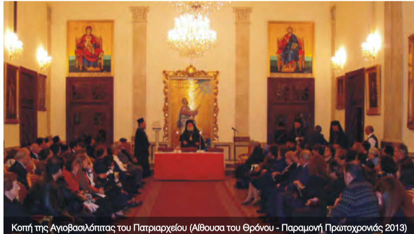
Κόπτη της Αγιοβασιλόπτας του Πατριαρχείου (Αίθουσα του Θρόνου - Παραμονή Πρωτοχρονιάς 2013)

Δέχθηκε τις ευχές της αιγυπτιακής κυβερνήσεως από υψηλούς αξιωματούχους του Υπουργείου Εσωτερικών και της Περιφέρειας Κάιρου και ευχήθηκε μέσα από την καρδιά του καλύτερες ημέρες για τον λαό της Αιγύπτου. Ευχές ανταλλάξε με τον Εξοχ.Πρόεδρο της Ελλάδας κ.Χριστόδουλο Λάζαρη, τον Εντιμ.Γενικό Πρόξενο της Κύπρου κ.Φώτη Φωτίου, τον Πρόεδρο της ΕΚΚ κ.Χρήστο Καβαλή και τον Πρόεδρο της Αραβορθοδόξου Κοινότητας κ.Ρομπέρ Χόσνι.