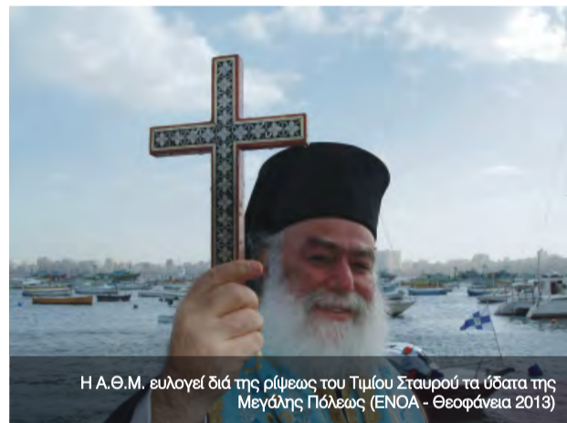
Η Α.Θ.Μ. ευλογεί διά της ρίψεως του Τιμίου Σταυρού τα ύδατα της Μεγάλης Πόλεως (ΕΝΟΑ - Θεοφάνεια 2013)