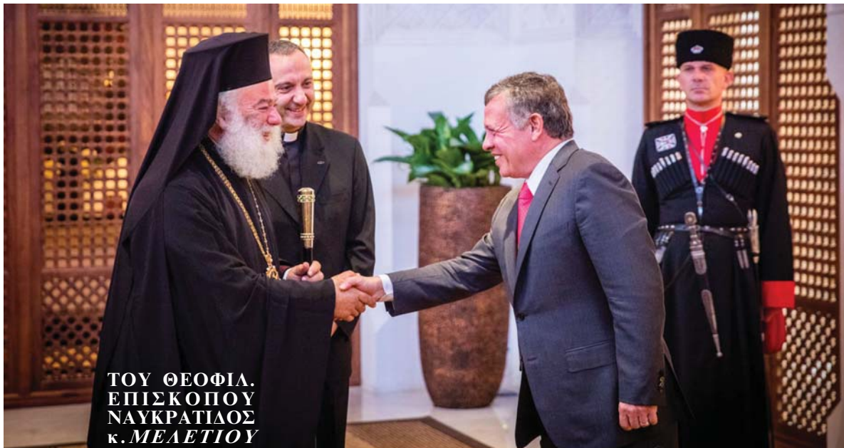
ΤΟΥ ΘΕΟΦΙΛ. ΕΠΙΣΚΟΠΟΥ ΝΑΥΚΡΑΤΙΔΟΣ κ. ΜΕΛΕΤΙΟΥ

Το παρόν σε αυτή την Συνέλευση μαζί με τον Αλεξανδρινό Προκαθήμενο, έδωσαν ο Πατριάρχης Αντιοχείας κ.κ. Ιωάννης, ο Πατριάρχης Ιεροσολύμων κ.κ. Θεόφιλος, ο Αρχιεπίσκοπος Κύπρου κ.κ. Χρυσόστομος, ο Κόπτης Πατριάρχης κ.κ. Twandros Β' καθώς και οι λοιποί προκαθήμενοι των υπολοίπων χριστιανικών Εκκλησιών (Καθολική, Αρμενική, Συροιακωβιτική και Ευαγγελική) από τον χώρο της Μέσης