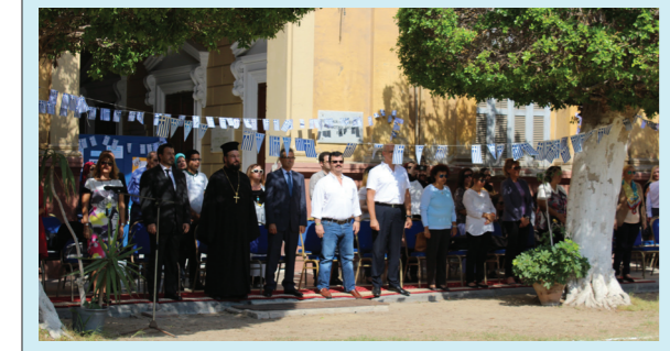
(συνέχεια από την 1 η σελίδα)

Τους Έλληνες ήρωες του έπους του "ΟΧΙ" τίμησε η Ομογένεια της Αλεξάνδρειας