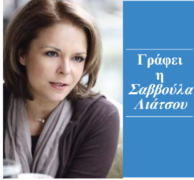
Γράφει η Σαββούλα Λιάτσου

«Hello Greece, thank you», ήταν οι πρώτες λέξεις του Μπαράκ Ομπάμα, ο οποίος στη συνέχεια του λόγου του, χρησιμοποίησε αρκετές ακόμα αναφερόμενες στην προσφορά της Ελλάδας στην ανθρωπότητα. Επικαλέστηκε τον Ηρόδοτο, τον Θουκυδίδη, τον Περικλή, μίλησε εκτενώς για τη Δημοκρατία, το Κράτος και την ελεύθερη βούληση, τονίζοντας ότι ο σημαντικότερος τίτλος είναι αυτός του «Πολίτη». Ο Αμερικανός Πρόεδρος αναφέρθηκε στην θρυλική φιλοξενία του ελληνικού λαού, προσθέτοντας ότι ήταν παιδικό του όνειρο να δει την