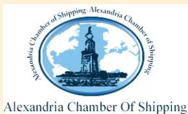
Alexandria Chamber Of Shipping