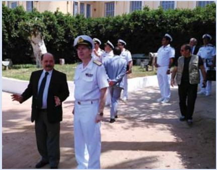
(συνέχεια από την 1 η σελίδα)

Η φρεγάτα "Νικηφόρος Φωκάς" ελλιμενίστηκε στην Αλεξάνδρεια στα πλαίσια της κοινής αεροναυτικής άσκησης Ελλάδας-Αιγύπτου, με την επωνυμία «Μέδουσα 2018», η οποία διεξήχθη από τις 11 έως και τις 12 Μαΐου, στη θαλάσσια περιοχή ανατολικά της Κρήτης. Στο πλαίσιο της συνεκπαίδευσης, εκτελέστηκαν τεχνικές ασκήσεις, ασκήσεις αεράμυνας και προσβολής στόχων επιφανείας. Στην άσκηση συμμετείχαν μονάδες του Πολεμικού Ναυτικού και της Πολεμικής Αεροπορίας, καθώς και αεροσκάφη της Πολεμικής Αεροπορίας της Αιγύπτου. Η «Μέδουσα 2018» εντάσσεται στο πλαίσιο του υφιστάμενου προγράμματος στρατιωτικής συνεργασίας των δύο χωρών.